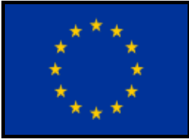
AVRUPA KOMİSYONU (EC)