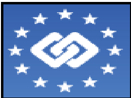
AVRUPA ÇALIŞMA VE YAŞAM KOŞULLARINI GELİŞTİRME VAKFI (EUROFOUND)